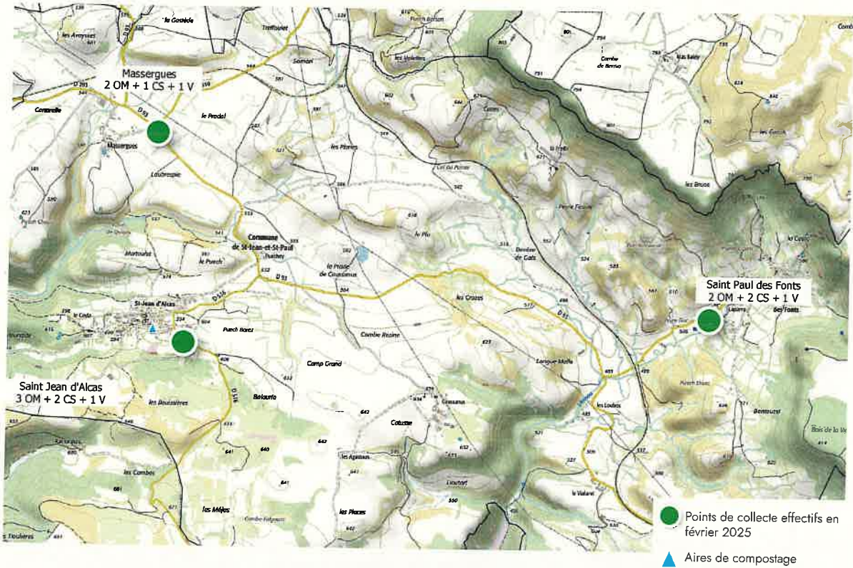
PAV 1 – Saint-Paul-des-Fonts

La localisation des futurs points a été définie en concertation avec les élus locaux et en tenant compte des contraintes techniques liées à ce nouveau mode de collecte des déchets