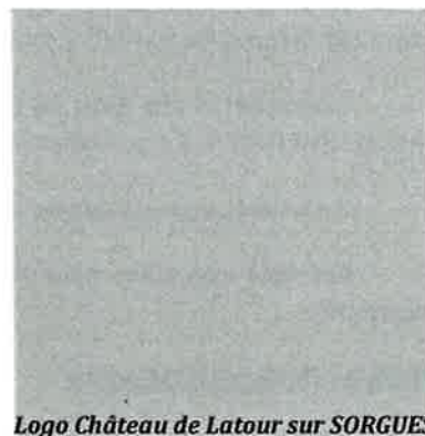
Logo Château de Latour sur SORGUES